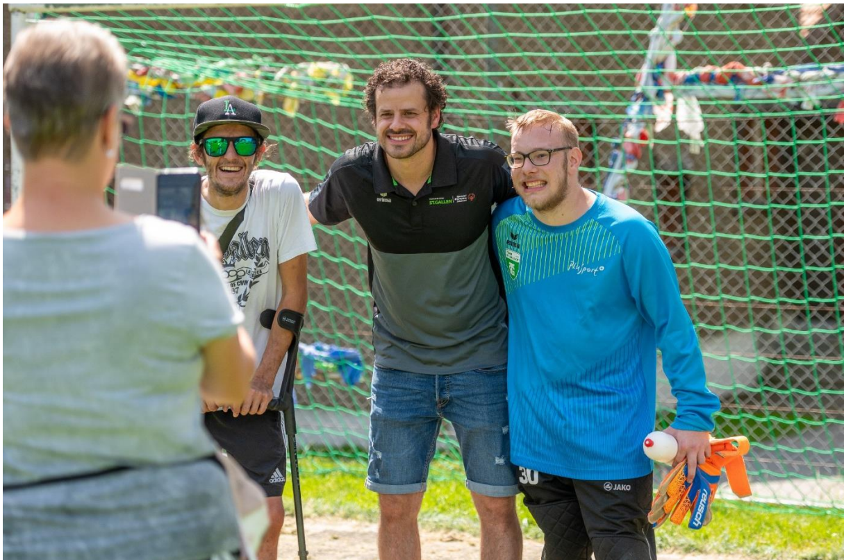
Ein Traum geht in Erfüllung – Gemeinsames Foto mit der FC SG Legende Tranquillo Barnetta