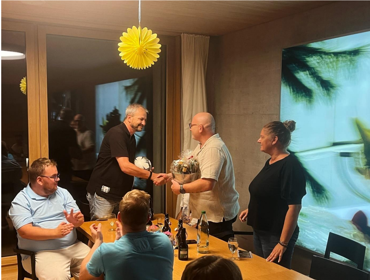
Bild 2: Ein herzliches Willkommen der Familie Cosi und Spielern des Teams FC Fortuna St. Gallen Unified in der Fortuna Familie